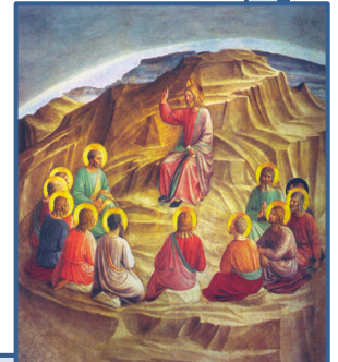
Le sermon sur la montagne (de Fra Angelico)

Du point de vue de l'histoire des idées, la possibilité d'un salut , nouveauté spirituelle et philosophique absolument radicale prêchée par Jésus et ses apôtres, a transformé en profondeur la perception du destin collectif : il est devenu possible d'envisager une société et un monde délivrés du mal. Face au scandale des injustes qui prospèrent et du mal qui sévit partout, cette conviction nouvelle se prêtait à être dévoyée . Autour de la communauté judéochrétienne première de Jérusalem, certains n'ont pas accepté que le messie attendu par le peuple hébreu puisse se faire serviteur et mourir crucifié. Bien que vénérant Jésus, ils ont réinterprété son enseignement et sa promesse de sauver le monde selon leur lecture des prophéties bibliques (Livre d'Isaïe, d'Ezechiel et particulièrement Livre de Daniel) : promesse du rétablissement de la royauté en Israël, de sa suprématie à venir sur les nations, telle que les méchants et les injustes seraient vaincus et que le mal serait banni de la terre. Selon ces messianistes , que les historiens ont appelé « judéonazaréens », Jésus aurait dû réaliser ce programme de son vivant mais en avait été empêché par la corruption d'Israël et de ses prêtres, par le dévoiement de la religion et par l'impureté du Temple : Dieu avait alors enlevé Jésus au ciel avant la crucifixion en attendant que des circonstances plus favorables permettent son retour et la réalisation des prophéties.