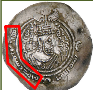
Première mention « islamique » à Mahomet apparaissant dans l'histoire (685-686), sur une pièce frappée à l'effigie d'un opposant au pouvoir califal

S'est alors ouverte une terrible période de guerre civile , où les Arabes ont cherché une justification religieuse à leurs prétentions au pouvoir et à leur conviction rémanente d'avoir été choisis par Dieu pour dominer la terre entière. Des oppositions entre factions, du jeu de surenchère auquel elles se sont livrées pour rivaliser de légitimité religieuse, sont nés les premiers concepts de l'islam :