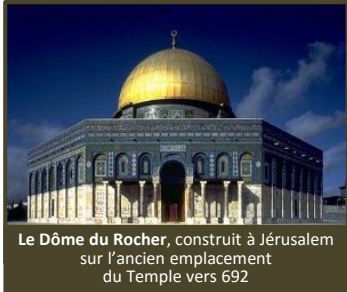
Le Dôme du Rocher, construit à Jérusalem sur l'ancien emplacement du Temple vers 692

C'était le sens de la construction du Dôme du Rocher (vers 692) et de ses inscriptions affirmant le prophétisme de Mahomet. Les califes successeurs ont alors fait composer et structurer la théologie islamique, le récit légendaire de l'apparition de l'islam et de la figure prophétique de Mahomet . C'est ainsi qu'ils ont justifié leur domination politique totale, jusqu'à la reprise du nom d'islam (« soumission », terme apparaissant au 8 e siècle) pour qualifier le mouvement politico-religieux messianiste nouveau des