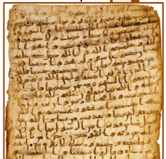
Manuscrit coranique sans diacritisme (fin 7 e siècle), conservé à Copenhague

Issues des travaux des orientalistes du 19 e siècle, l'islamologie et la recherche historique sur les origines de l'islam mettent de plus en plus en cause la véracité des traditions musulmanes . L'historiographie classique issue de ces dernières (naissance de l'islam entre La Mecque et Médine par la seule prédication de Mahomet) est contestée frontalement par l'application des méthodes critiques expérimentées et éprouvées par les recherches sur les origines du christianisme et sur ses manuscrits. Les nouvelles technologies permettent non seulement des études inédites (par exemple l'analyse informatique systématique du texte coranique) mais surtout la mise en réseau de chercheurs issus des domaines les plus variés – histoire, numismatique, archéologie, exégèse, philologie, paléographie, linguistique ... Ainsi, alors que les découvertes de témoignages historiques non conformes à l'historiographie classique se sont multipliées, des analyses nouvelles ont ébranlé les dogmes islamologiques, notamment grâce à Patricia Crone, Alfred-Louis de Prémare, Günter Lüling, précurseur des travaux de Christoph Luxenberg, Claude Gilliot, etc.